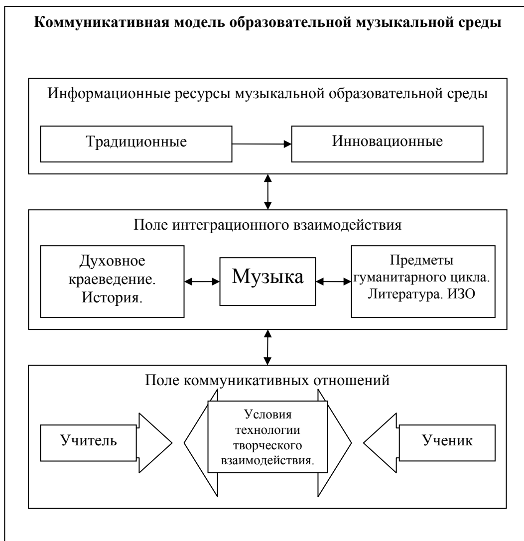
Рисунок 1. Коммуникативная модель образовательной музыкальной среды

Для полноценного формирования духовно-нравственной культуры и реализации творческих способностей подростков, в музыкальной образовательной среде необходимо создать определенные условия. Назовем лишь главные из них.